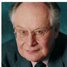
Prof. Dr. Peter Glotz