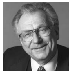
Dr. h.c. Lothar Späth