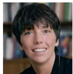
Dr. Margot Käßmann