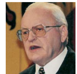
Prof. Dr. Roman Herzog