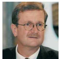
Dr. Wendelin Wiedeking