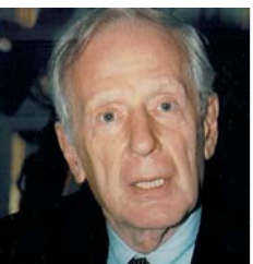
Dr. Klaus von Dohnanyi