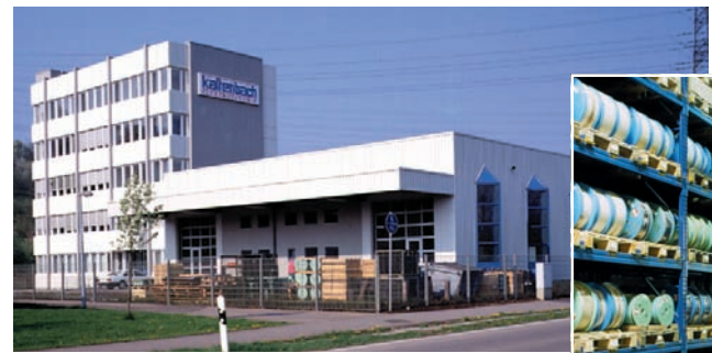
Der Firmensitz mit Zentrallager seit 1990 im eigenen Gebäude in Deizisau.

Firmengründer Werner Kaltenbach kann das Jubiläum seines Lebenswerkes nicht mehr miterleben. Er verstarb im September 2006, zwei Jahre nach seiner Ehefrau Friedl Kaltenbach, die für die Bereiche Finanzen und Personal verantwortlich war und ebenfalls einen wesentlichen Anteil am großen Erfolg des Unternehmens hatte.