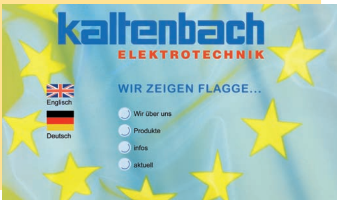
Homepage in dritter Generation. Kontakt: www.kaltenbach-online.com

Für zwölf Produktgruppen stehen Kataloge und ausführliche Datenblätter bereit. So sind Kunden immer auf dem neuesten Stand.