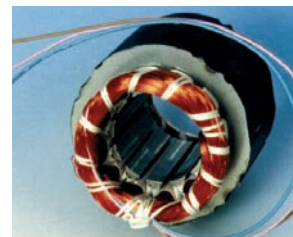
RADOX® – wärmebeständige Anschlussleitungen