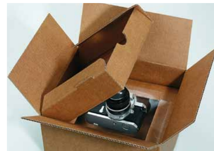
Membranpolsterverpackungen bieten besonderen Produktschutz durch die „frei schwebende“ Position des Produktes.

Nahezu alle Marktteilnehmer werden mit ähnlichen Herausforderungen konfrontiert. Durch die noch junge Vertriebskooperation „DIWA“ (Dill-Wackler) kann aus einer Hand ein schlüssiges Verpackungs- und Versandkonzept für jeden